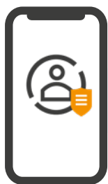
Smartphone mit SECURE CONTACTS APP (Intune Managed App)

Vollständige Integration in die Microsoft-Welt bei lückenloser Daten- und Informationssicherheit